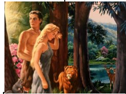
Sündenfall 1Mo 3:1-8