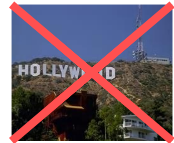
LESEN & ANSCHAUEN (Sehen)

Durch unsere Sinne versucht Satan Kontrolle über unseren Verstand zu erlangen